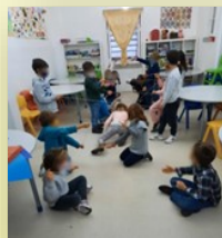
Laser de fio

Em pares, colocaram um fio esticado em diversos ângulos. Um dos criativos tinha que percorrer o corredor, sem tocar em nenhum fio.