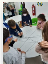
Novelo de lã

Um novelo de lã passa de mão em mão ao desenrolar. Depois um menino, de olhos vendados, ouve as indicações e tem que tornar a formar o novelo.