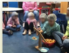
Culinária com peso e medida